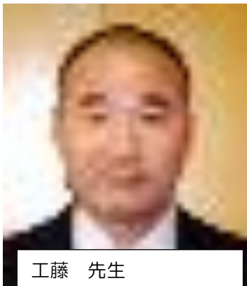
工藤 先生 再任用初任者指導加配